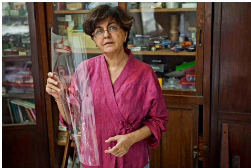
右图 纳里尼·马拉尼在她于 孟买的工作室中

马拉尼曾在世界各地的博物馆举行回顾展和个人展览，参与过多个群体展览和双年展，并曾获多个崇高奖项，包括福冈亚洲文化奖 (2013)、圣莫里兹艺术大师终身成就奖 (2014)、香港亚洲艺术创变者大奖 (2016)、巴塞罗那胡安·米罗奖 (2019)，以及首届伦敦国家美术馆当代创作研究奖 (2020)。马拉尼的作品为超过三十家公共机构所收藏，包括纽约现代艺术博物馆、纽约大都会博物馆、阿姆斯特丹市立博物馆、伦敦泰特现代美术馆、巴黎蓬皮杜中心国家现代艺术博物馆、香港 M+ 博物馆、新德里克兰纳达美术馆，以及悉尼新南威尔斯美术馆。